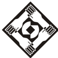
ตัวอย่างที่ ๒