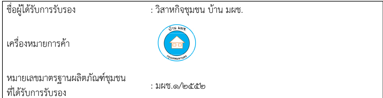
ตัวอย่างที่ ๑