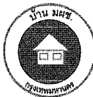
ตัวอย่างที่ ๔