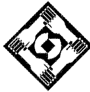
ตัวอย่างที่ ๒