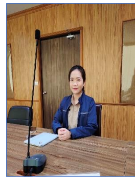
คณะวิทยากรจากกลุ่มงานวินัยและต่อต้านการทุจริต สำนักงานเลขาธิการกรม สำนักงานมาตรฐานผลิตภัณฑ์อุตสาหกรรม